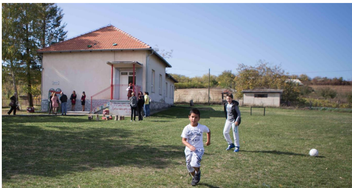
L' edificio che ospita la scuola

Toccherà tra poco alla Scuola Primaria di Drenovac vedere realizzati i sogni di tanti bambini di questo villaggio rurale a pochi chilometri ad ovest di Kragujevac, dove inizieranno i lavori di ristrutturazione della loro piccola scuola con tanto spazio verde all' esterno, in fondo al quale si trova la piccola e vetusta cabina che ospita i servizi igienici. Oltre a questi, verrà realizzato l' impianto di riscaldamento, altro " lusso " - al pari dei bagni – in una zona dove si toccano anche i – 20°.