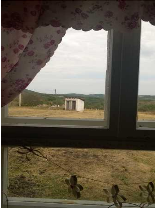
Vista degli attuali servizi dalla scuola

famiglie che possono sopportare la spesa del trasporto, piuttosto che far soffrire i loro figli a causa del disagio e del freddo, preferiscono iscriverli a scuole situate in città dove ci sono quasi sempre edifici scolastici in condizioni migliori. Tante volte i nostri interventi di risanamento sono riusciti ad evitare la chiusura di queste piccole scuole di paese, con vantaggi anche per le famiglie che non devono farsi carico di spese di trasporto e possono avere i bambini vicino casa. Infine, ho il dovere di spezzare una lancia in favore degli insegnanti di queste scuole di frontiera i quali sono oltrechè giovani anche abbastanza motivati, come la maestra della scuolina di Drenovac.