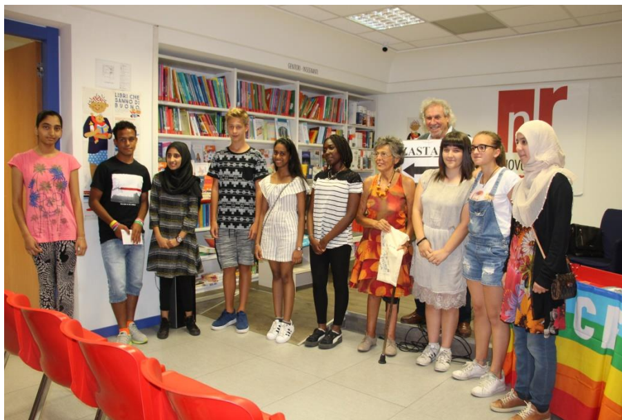
UN MOMENTO DELLA CONSEGNA DEI CONTRIBUTI PER LO STUDIO 2017