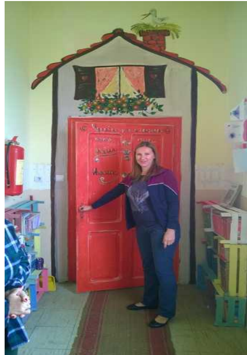
Arte e decoupage, meriti della appassionata maestra