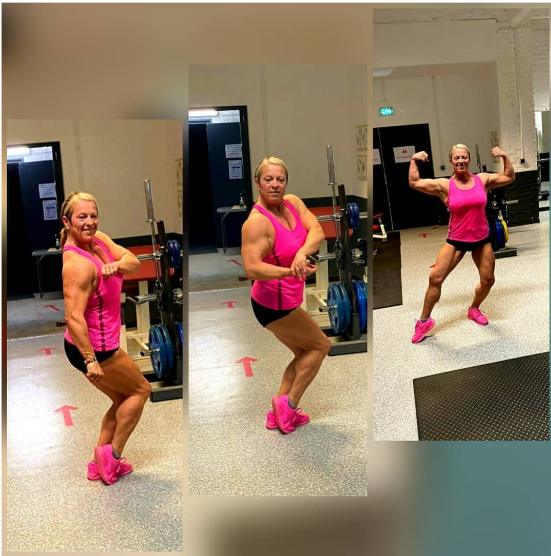
#athlete #athletics #running #runner #professional #discus #championship #trackandfield #furious #determination #determined #focused #beastmode #sportsphotography #canon #canonphotography #canon6d #discipline #lithuania #passion #longjump #sprinter #sprint #fitness #fit #motivation #workout #highjump #dontstop #hardworkpaysoffs @lengvoji @lteam_official @visitpalanga 719