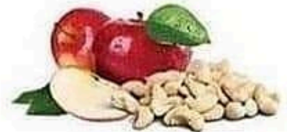
Apple & Handful of Cashews