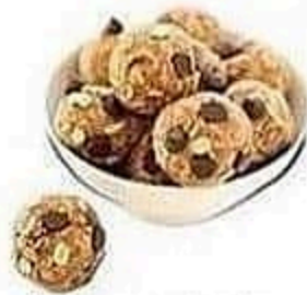
Homemade Energy Balls