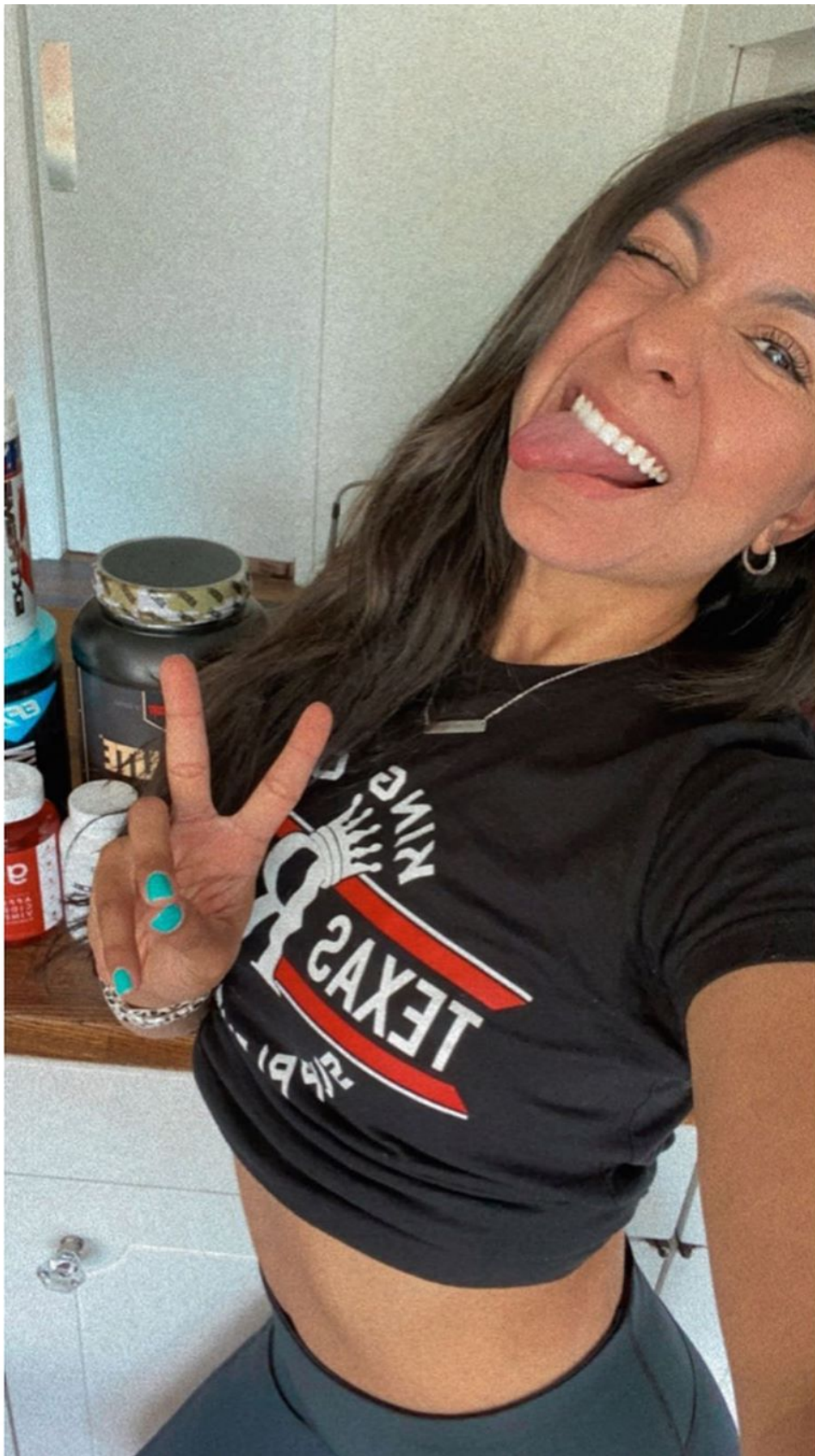
#athlete #power #speed #golf #golfer #liveunderpar #golfers #progolfer #golpro #golfing #golfswing #golfcourse #golfstagram #golflife #golfdlay #summer #practice #NY #Newyork #instafollow # # # # # # # # # # # # # # # # # # # # # #