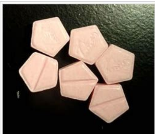
17α-methandrostenolone confiscated by the DEA in 2008.

Wenn Sie Nebido 1000mg Injektionslösung kaufen möchten, wählen Sie bitte die gewünschte Menge aus und klicken Sie dann auf "in den Warenkorb". Wenn Sie ein Rezept haben, wählen Sie bitte zusätzlich aus, um welche Art von Rezept es sich handelt. Zusatzinformationen Ihrer Online-Apotheke. Anwendungsgebiete - Unterfunktion der Keimdrüsen bei Männern (Hypogonadismus) durch einen Mangel an. Die Testosteronpräparate (Nebido. E-Rezept. Magen-Darm-Beschwerden Tiefkühlpizza, Fertigprodukte. » Zu den Artikeln. Beratung Erschwerte Bedingungen Chronische Obstipation erfordert meist