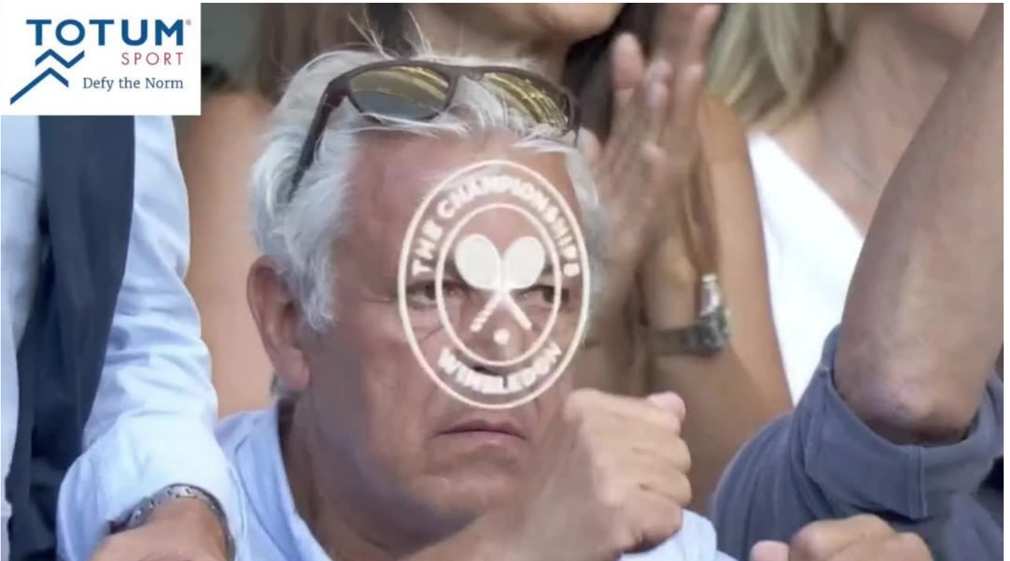
Nordex Somatropin hGH (50 IU's Kit) Russian $ 200.00 $ 149.00 / 0.0142 B Human Growth Hormone Nordex(HGH, Somatropin) in 10iu Kit 5 vials in box(50iu total) and