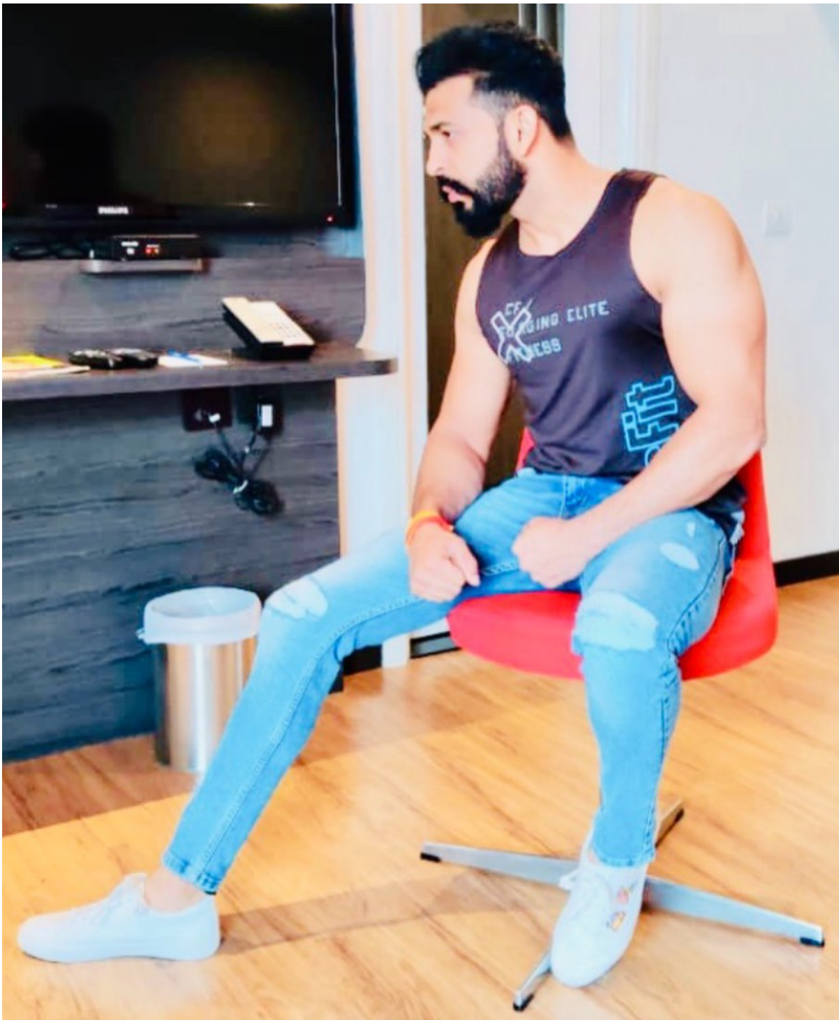
Guess my weight!! Not at all satisfied with this current package, but WE WORKIN I'm just happy @thefactory502 I can lift with my shirt OFF without being judged #JudgementFreeZone