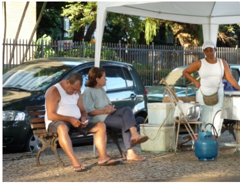
Déambulation musicale à Salvador de Bahia. Déambulation musicale. A mille lieues de Sao Paulo et de Rio de Janeiro, Salvador de Bahia a jusqu'à présent résisté à la frénésie de la modernité. L'ex-capitale du Brésil invite à caler son pas sur celui des grands noms de la bossa-nova et de la samba. Déambulation musicale à Salvador de Bahia.