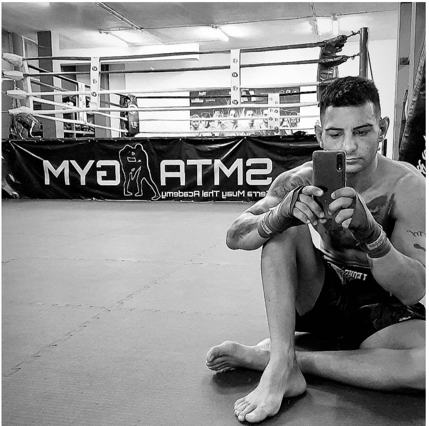
Steryd / Masteron / Najlepszy na redukcję? - Krzysztof Jarocki - Duration: 6:24. Świat Supli - Sklep z odżywkami i suplementami , odżywki suplementy ciuchy, odzież na siłownię 3,454 views