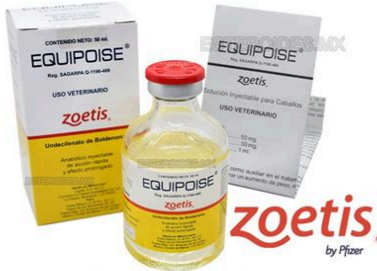
Zoetis, la filial especializada en salud animal de Pfizer

Impuesto predial 2024: ¿Qué es, para qué sirve y dónde se paga? Aunque no se tiene un cálculo estimado de cuándo se empezó a cobrar el predial, es una obligación que acompaña a los .